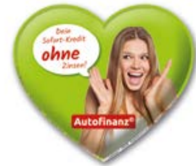
Ansicht des fertigen CarKoser®