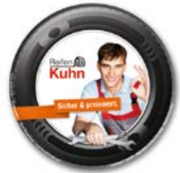
Ansicht des fertigen CarKoser®

* Diese Angaben sind Pflichtangaben. Sie dienen dem Schutz vor Plagiaten und dürfen daher nicht entfernt werden.