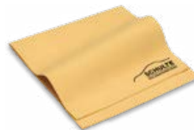
Ansicht des fertigen, viertelgefalteten Autotuchs.