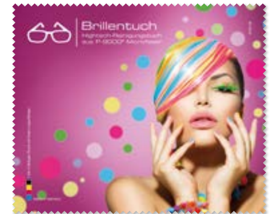
Ansicht des fertigen Brillentuchs