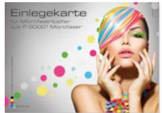
Ansicht der fertigen Einlegekarte

— = Druckfläche 246 x 186 mm inkl. 3 mm Beschnittzugabe