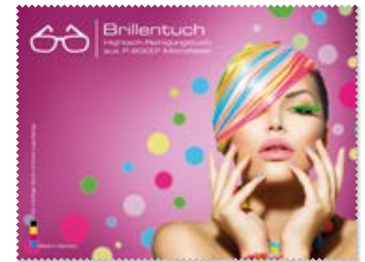
Ansicht des fertigen Brillentuchs