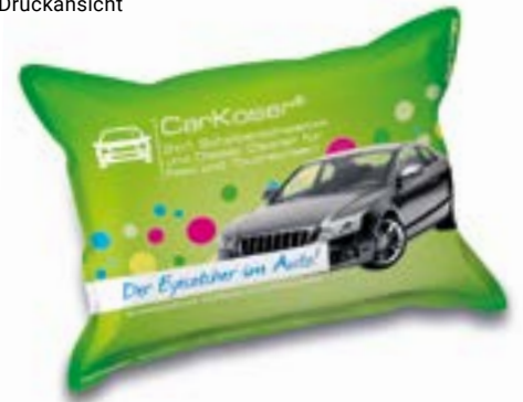
Ansicht des fertigen CarKoser®

* Diese Angaben sind Pflichtangaben. Sie dienen dem Schutz vor Plagiaten und dürfen daher nicht entfernt werden.