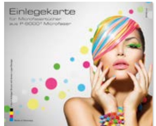
Ansicht der fertigen Einlegekarte

— = Druckfläche 176 x 146 mm inkl. 3 mm Beschnittzugabe