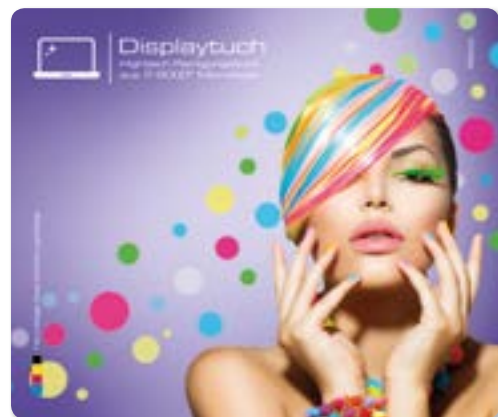
Ansicht des fertigen Displaytuchs