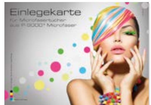
Ansicht der fertigen Einlegekarte

— = Druckfläche 216 x 156 mm inkl. 3 mm Beschnittzugabe