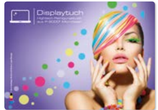
Ansicht des fertigen Displaytuchs