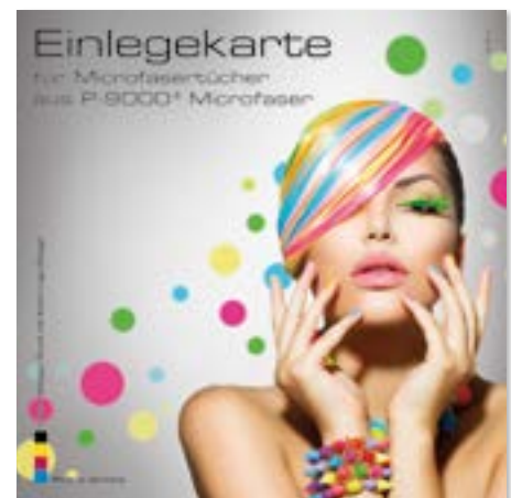
Ansicht der fertigen Einlegekarte