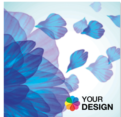
Ansicht des fertigen Universal-Microfasertuchs

• Wir empfehlen diese Angabe aufgrund der Textilkennzeichnungsverordnung.