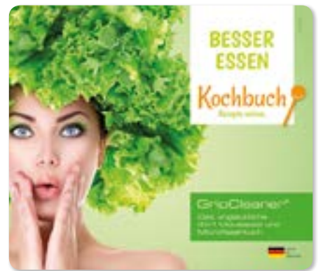
Ansicht des fertigen GripCleaner®

• Wir empfehlen diese Angabe aufgrund der Textilkennzeichnungsverordnung.