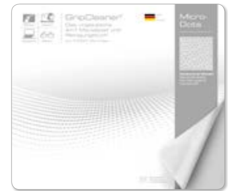
Ansicht der fertigen Einlegekarte