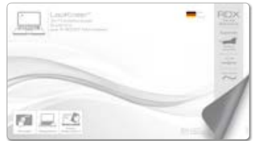
Ansicht der fertigen Einlegekarte

— = Druckfläche 286 x 166 mm inkl. 3 mm Beschnittzugabe