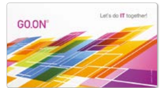
Ansicht des fertigen LapKoser®