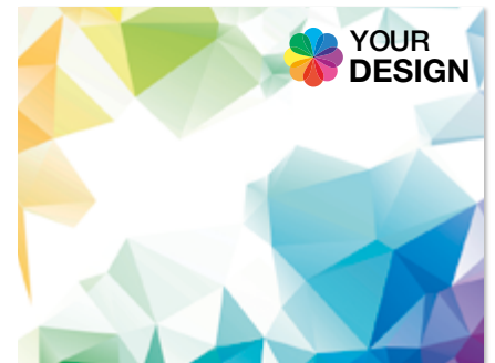
Ansicht des fertigen DoubleCleaner®

• Wir empfehlen diese Angabe aufgrund der Textilkennzeichnungsverordnung.