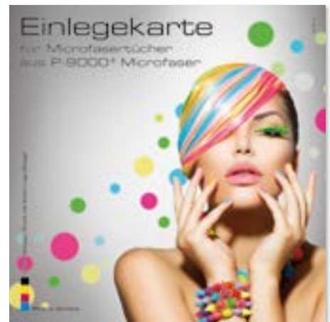
Ansicht der fertigen Einlegekarte