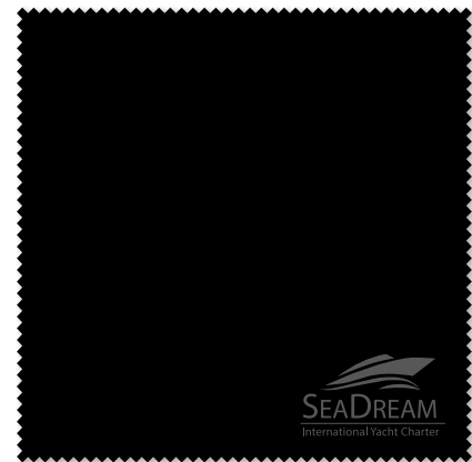
Ansicht des fertigen Prägetuchs mit Zickzack-Rand