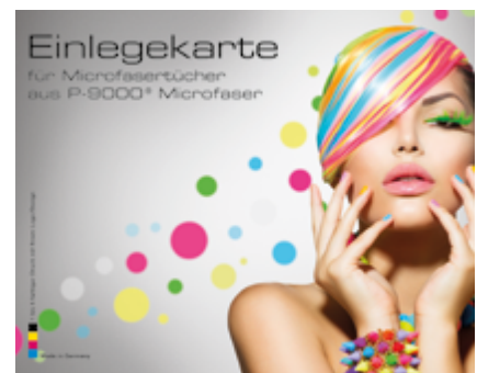
Ansicht der fertigen Einlegekarte