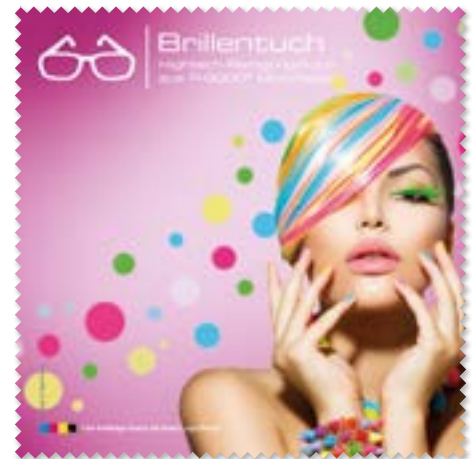
Ansicht des fertigen Brillentuchs