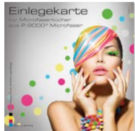
Ansicht der fertigen Einlegekarte

— = Druckfläche 186 x 186 mm inkl. 3 mm Beschnittzugabe