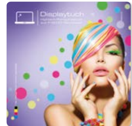
Ansicht des fertigen Displaytuchs