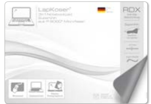
Ansicht der fertigen Einlegekarte

— = Druckfläche 216 x 156 mm inkl. 3 mm Beschnittzugabe