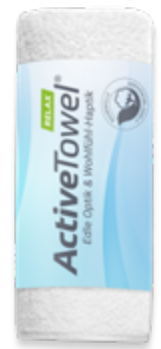
Ansicht ActiveTowel® Relax gerollt mit Banderole

— = Druckfläche 196 x 106 mm inkl. 3 mm Beschnittzugabe