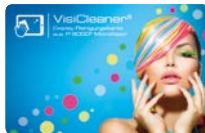
Ansicht des fertigen VisiCleaner®

— = Druckfläche 91 x 61 mm inkl. 3 mm Beschnittzugabe