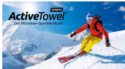
Ansicht des fertigen ActiveTowel® Sports