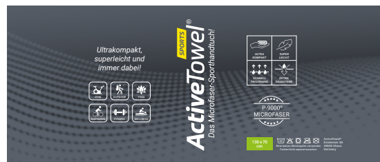
Ansicht der fertigen Banderole