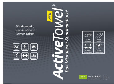
Ansicht der fertigen Einlegekarte