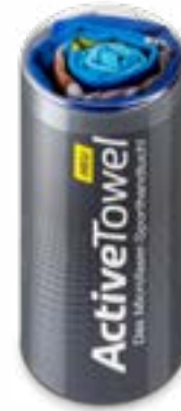
Ansicht in Runddose