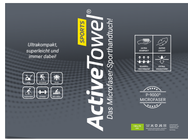
Ansicht der fertigen Einlegekarte