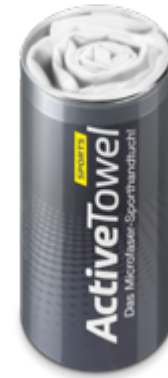
Ansicht in Runddose

— = Druckfläche 271 x 206 mm inkl. 3 mm Beschnittzugabe