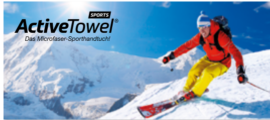
Ansicht des fertigen ActiveTowel® Sports