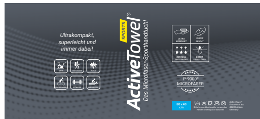
Ansicht der fertigen Banderole