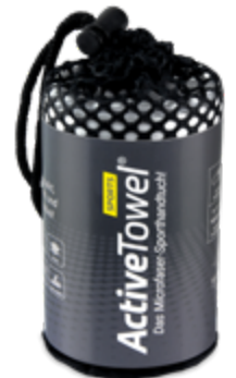
Ansicht im Netzbeutel

— = Druckfläche 231 x 106 mm inkl. 3 mm Beschnittzugabe